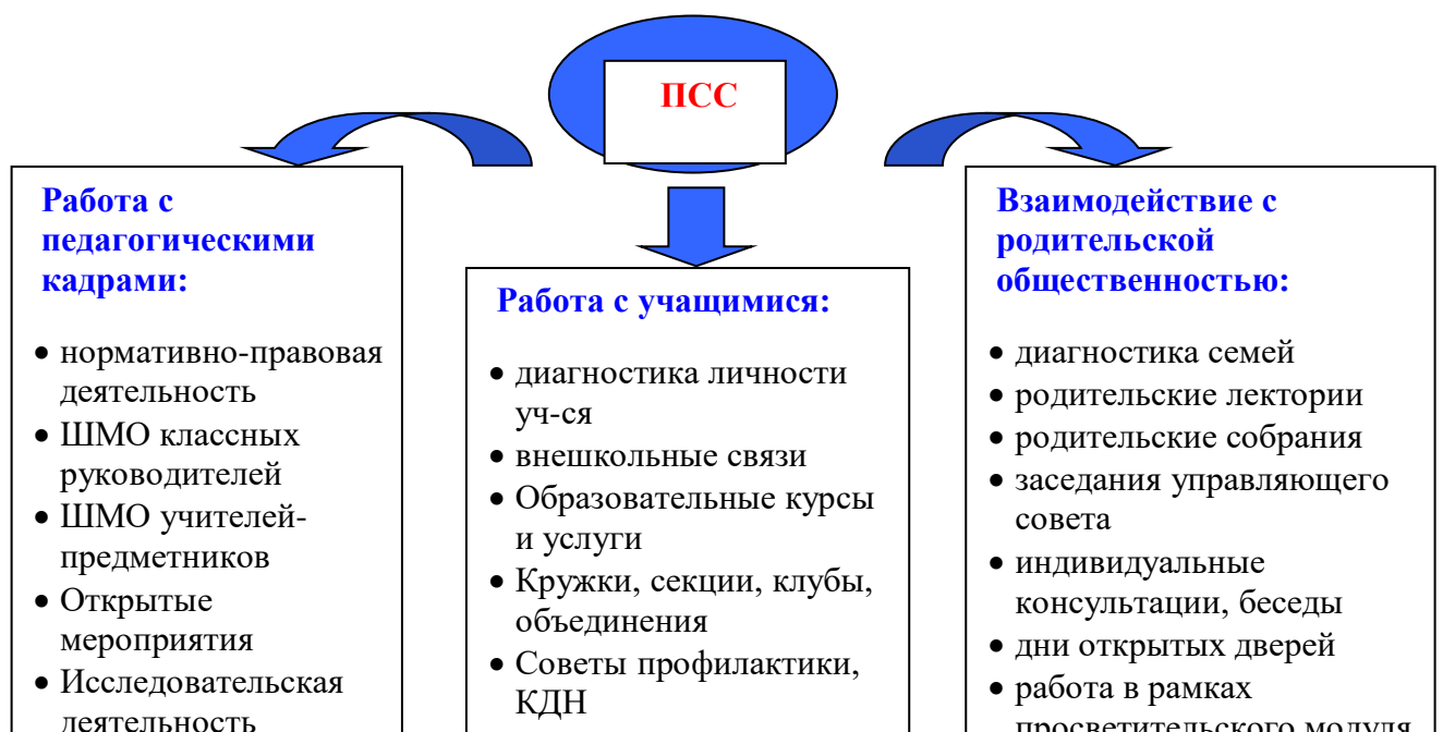
Схема. Психолого-педагогическое и социальное сопровождение учебно-воспитательного процессе.

Учитывая современные требования к условиям становления ребёнка как личности самодостаточной, открытой и способной легко адаптироваться к быстро меняющемуся миру, основными категориями «качества жизни» и их сопровождения рассматриваются: здоровье, социальное благополучие, самореализация, защищённость.